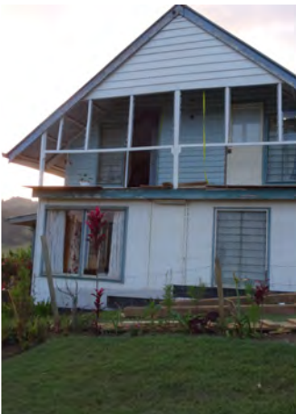
Kohta saadaan ikkunat paikoilleen