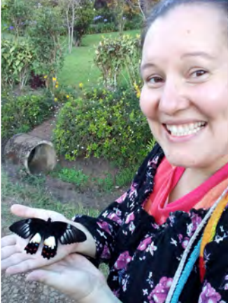
Sadekausi saa ötökätkin liikkeelle