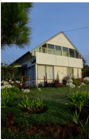
Ulkoapäin talo näyttää jo ihan hyvältä.

Emilton (intialainen 7-luokkalainen poika) on asunut meillä nyt 1,5kk, kun ei ole asuntola koululaisille. On ollut ilo huomata, että hän alkaa pikkuhiljaa jo saada kavereita. Intialaiseen ruokaan tottuneelle suomalainen kotiruoka on aika miedosti maustettua, joten Emiltonilla menee pullollinen tabascoa kahdessa viikossa.