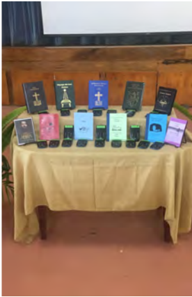
valmistuneet Raamatut ja ääniraamatut.