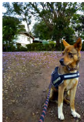
Jakarandan kukat värjäävät taustalla koko tien violetiksi.