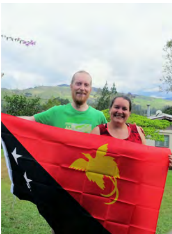
Papua-Uusi-Guinea 44-v itsenäisyyttä