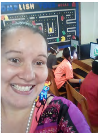
Koululaisilla alkoi syysloma