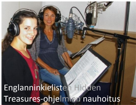
Englanninkielisten Hidden Treasures-ohjelmien nauhoitus