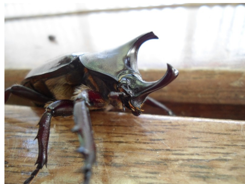
Koppakuoriaisella pituutta 6cm. Verannalle pyykkiä ripustaessa saa olla tarkkana mihin astuu paljain varpain.