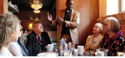
Senegalin lähettiläiden tapaaminen