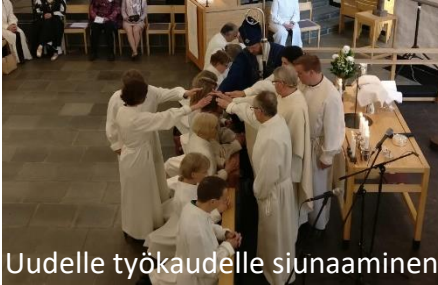
Uudelle työkaudelle siunaaminen