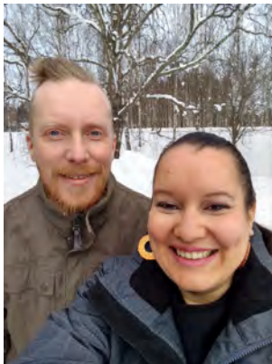
Talvisissa maisemissa kotipihalla Ryttylässä.