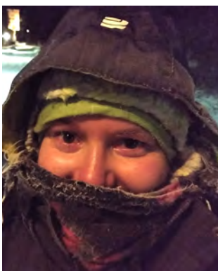
Kerrospukeumista on saanut harjoitella täällä Etelä-Suomessakin.

Papua-Uudessa-Guineassakin koronartuntoja on ollut hiukan aikaisempaa enemmän. Tartunnat eivät kuitenkaan ole johtaneet vakaviin oireisiin. Lähetyskeskuksen sisällä työntekijät pyrkivät käyttämään maskeja ja huolehtimaan hyvästä ilmanvaihdosta.