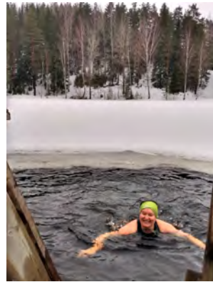
Avantouintia ei ainakaan Ukarumpassa pääse harrastamaan.