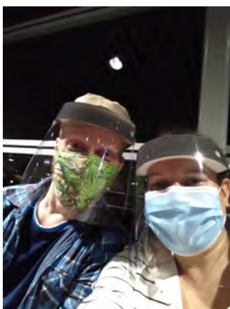
Lennoilla maski ja visiiri olivat pakollisia jokaiselle matkustajalle.

Karanteenin loputtua lähdimme Lappiin. Joulun vietimme mökkeillen Ylläksellä. Ulkoilimme ja vietimme aikaa perheen ja sukulaisten kanssa. Rinteeseen emme tällä kertaa lähteneet, kun hissijonot olivat niin pitkiä. Joulupukkikin kävi koronaturvallisesti jättämässä lahjat oven taakse. Vain isot saappaan jäljet näkyivät tuoreessa lumessa.