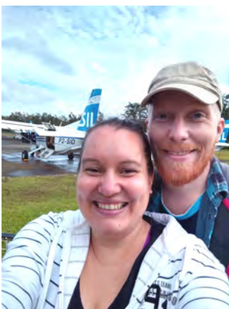
Odotellaan lähtöä Ayuran lentokentällä Ukarumpassa.