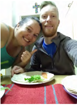
Matkan jälkeen ensimmäinen ateria Suomessa.