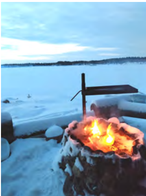
Kaunis kaamospäivä Näätämissä.