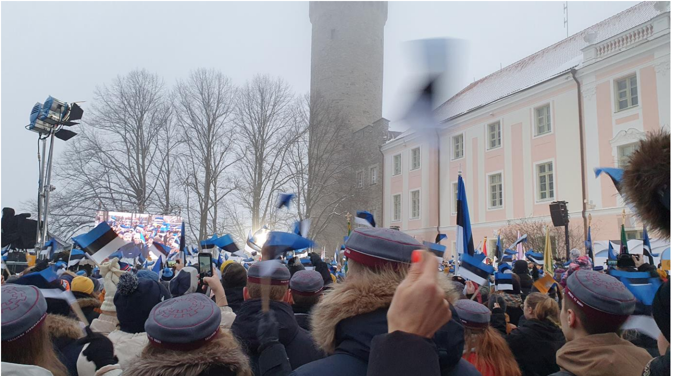
Itsenäisyyspäivän (24.2.) lipunnoston tunnelmia Pitkän Hermannin tornin juurella