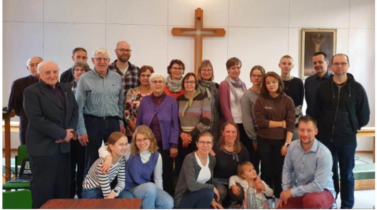
Hietoinrannassa oli koolla ilahduttavan monenikäistä väkeä.

Viron kieltäkin pääsee hyödyntämään välillä yllättävissä paikoissa. Kokkolalaiset tietävät nyt, että ainoa viroon hepreasta tullut lainasana on luomiskertomuksen alun kuvaama ”tohuvaohu” – ”kaaos”, ja hietoinrannan leiriläiset saivat lisähaastetta Aliakseen, kun oikea sana pitikin yrittää ymmärtää vironkielisestä selityksestä.