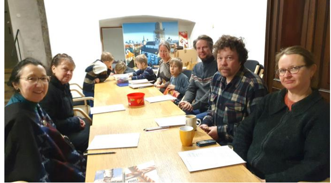
Vuoden ensimmäinen raamattutunti Tuomiokirkossa

Koko Raamatun tiivistäminen seitsemään–kahdeksaan tuntiin on aika haastava tehtävä, mutta tavoitteeni on, että kurssi antaisi kokonaiskuvan Raamatusta ja sen alusta loppuun kulkevasta Jumalan pelastussuunnitelmasta. Kun on parempi ymmärrys kokonaisuudesta, on toivottavasti helpompi myös itse tarttua Raamattuun ja syventyä siihen, mistä kurssilla ehdimme raapaista vain pintaa. Kun muutama vuosi sitten pidin raamattutunteja Rakveressa ja luettiin Jesajan kirjaa, muistan erään seurakuntalaisen innostuksen, kun hänelle selvisi, että Vanhassa testamentissakin puhutaan Jeesuksesta ja Raamatun läpi kulkee yhtenäinen punainen lanka. Tämän punaisen langan äärellä vietän nyt tiivistä helmikuuni, koska ensimmäinen versio kurssista pitäisi olla valmiina pidettäväksi 25.-26.2. Myös Tuomiokirkkoseurakunnan kuukausittaisilla raamattutunneilla kokoonnutaan tämän saman teeman äärelle.