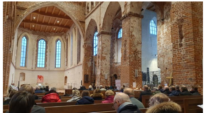
Tänä vuonna Tartossa pidetty papiston konferenssi alkoi jumalanpalveluksella Johanneksenkirkossa.

Tammikuu kului lähinnä palaverien, suunnitteluiden ja yhteydenottojen merkeissä. Vietin pari päivää myös Viron papiston konferenssissa pitääkseni esillä mahdollisuutta tilata Lähetyskeskuksen koulutuksia seurakuntiin. Mukavaa oli huomata, että parissa viime keväältä tutussa seurakunnassa oli odotettu paluutani ja toivottiin tälle keväälle lisää koulutusta. Erityisesti ilahdutti toisesta tullut palaute: ”Koulutuksesi innosti työskentelemään uskonkysymysten kanssa ja olemme kuluneen vuoden aikana kovasti kehittyneet.” Tämänkaltaisessa kiertävässä työssä ei turhan usein työn tuloksia pääse näkemään tai kuulemaan.