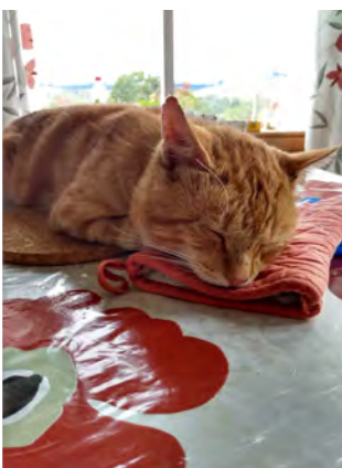
Kissan elämää. Patakinnas on hyvä tyyny.

Tuntuu hurjalta, kun väki hiljalleen vähenee, eikä kukaan pääse palaamaan. Kuinka kauan tämä erikoistilanne voi jatkua? Moniin kysymyksiin ei vastauksia juuri nyt ole saatavilla.