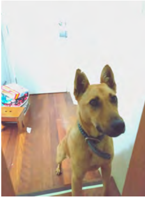
Nala-koira asuu nyt meillä, kun Sadeharjujen perhe on Suomessa.