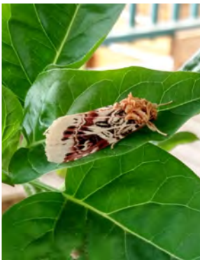
Kaunis yökkönen meidän terasilla.